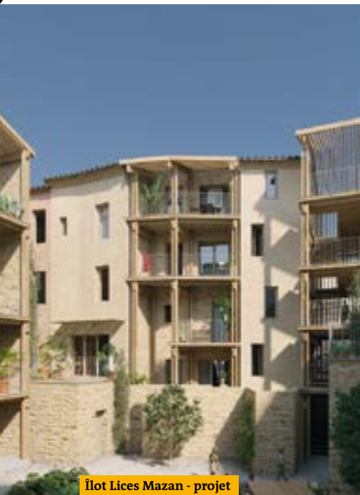
Îlot Lices Mazan - projet