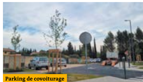
Parking de covoiturage

Pensez-y, le covoiturage présente des avantages !