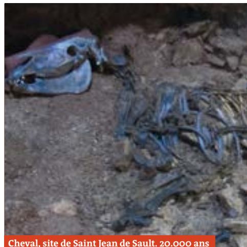
Cheval, site de Saint Jean de Sault. 20.000 ans