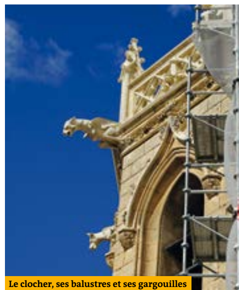
Le clocher, ses balustres et ses gargouilles

Petit rappel : depuis la loi de séparation de l'église et de l'État l'entretien des équipements culturels construits avant 1905 incombe dans la majorité des cas aux municipalités. Encadrés par la Direction Régionale des Affaires Culturelles, le bâtiment, protégé au titre des Monuments Historiques, est soumis à une réglementation exigeante.