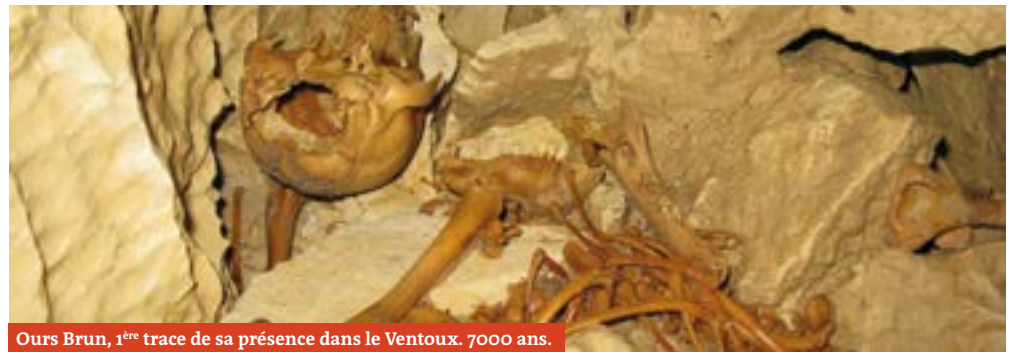
Ours Brun, 1 ère trace de sa présence dans le Ventoux. 7000 ans.

Groupe spéléologique de Carpentras - DRUART Gilles - 06.86.27.46.37 - gillesdruart3@orange.fr